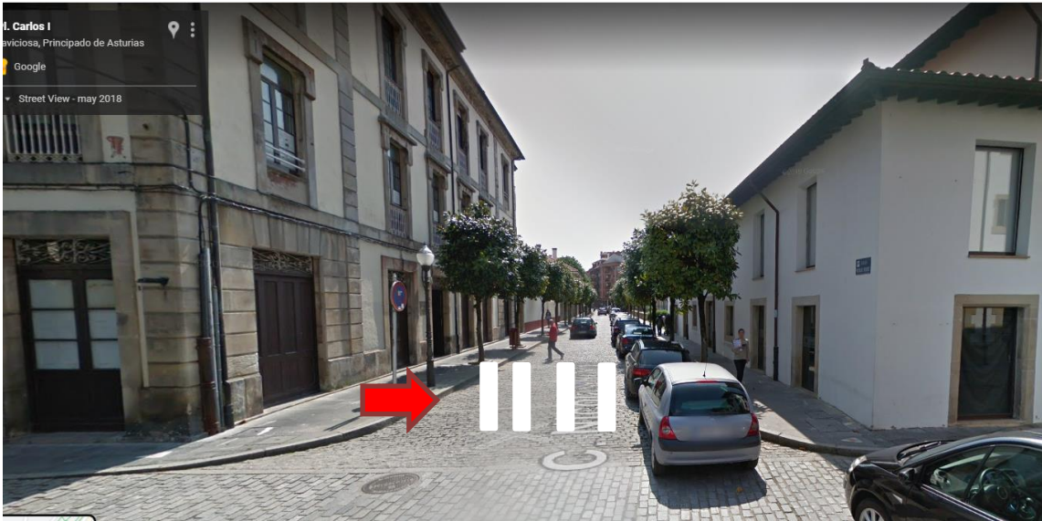
Figura 7: mobiliario urbano y carteles que limitan el paso de peatones en la en la calle del Sol, en la intersección con la calle Nicolás Rivero.