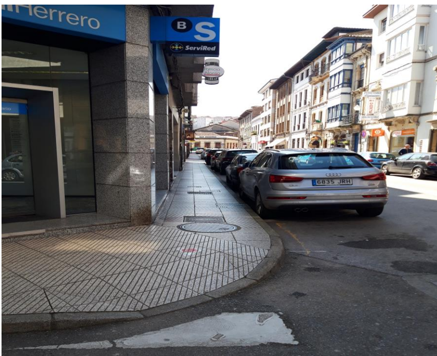
Figura 10: localización del paso de peatones a la altura del banco Herrero.

2.8 Modificar el paso de peatones de la calle Balbín Busto en correspondencia del banco Herrero (Figura 10).