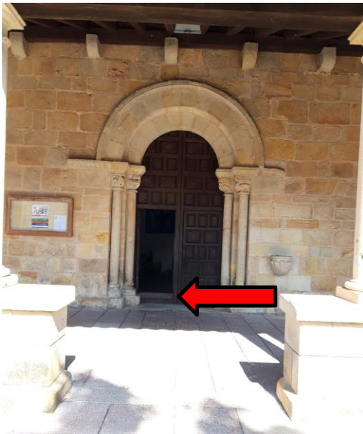
Figura 3: acceso principal de la iglesia de la Oliva.

3.2 Eliminar el escalón de acceso a la casa de los Hevia (Figura 12).