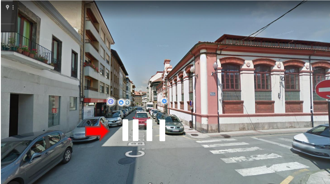
Figura 9: localización del nuevo paso de peatones.

2.8 Modificar el paso de peatones de la calle Balbín Busto en correspondencia del banco Herrero (Figura 10).