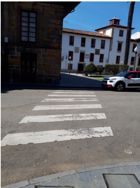
Figura 4: Estado actual del paso de peatones plaza José Cavada y Nava

2.4 Adaptar el paseo de peatones de la plaza José Cavada y Nava (Figura 4).