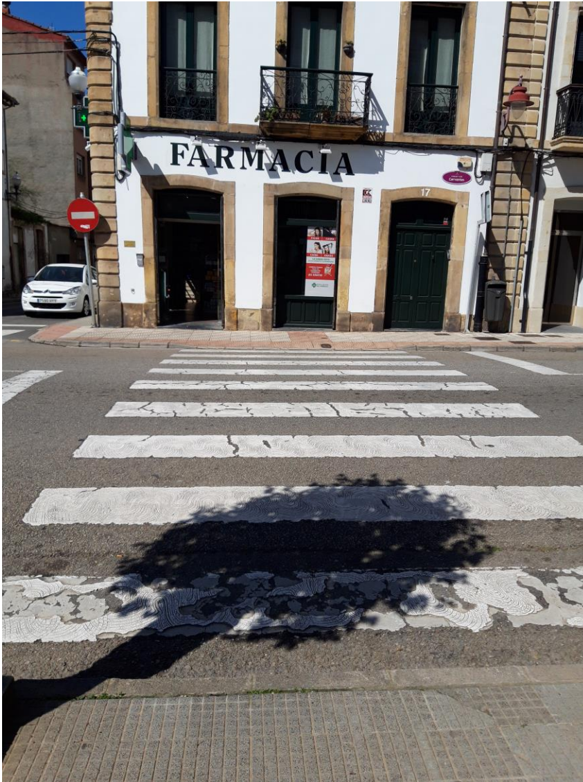
Figura 11: estado del paso de peatones a la altura del restaurante “Lena” en calle Cervantes 2.

2.9 Crear un paso de peatones accesible a la altura de la calle Cervantes 2, en el lado de la acera de la sidrería “Lena” (Figura 11).