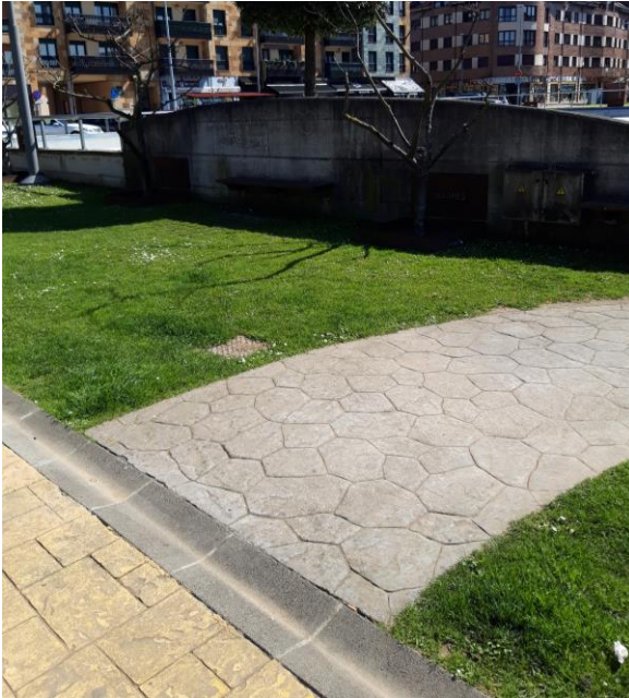
Figura 1: concavidad a la entrada del parque.

2.2 Para quien viene en coche y empieza la ruta desde el aparcamiento de la N632, prever la predisposición de al menos dos plazas de aparcamiento con tarjeta azul de discapacidad en el callejón del Cantu (Figura 2).