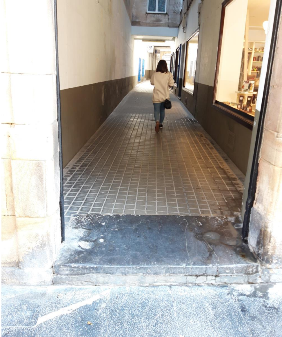
Figura 8: escalón del pasaje, lado calle del Sol.

2.6 Rebajar el escalón del pasaje que conecta la calle del Sol con la Calle Balbín Busto (Figura 8).