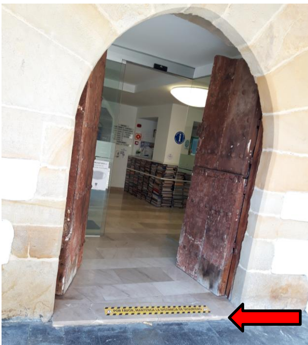
Figura 12: acceso actual de la casa de los Hevia.

3.2 Eliminar el escalón de acceso a la casa de los Hevia (Figura 12).