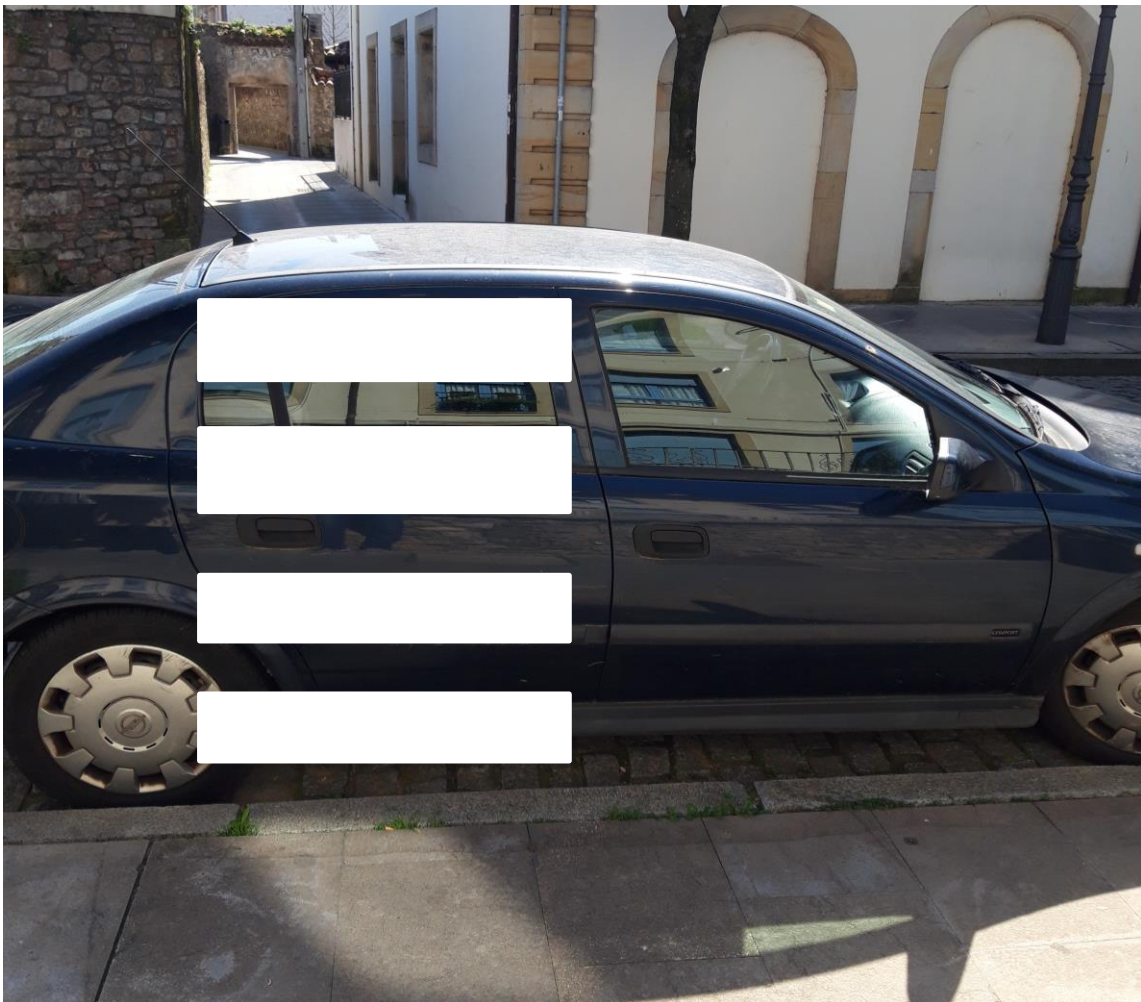
Figura 5: localización del nuevo paso de peatones en correspondencia de calle Indias en la intersección con calle Nicolás Rivero.

Lo ideal sería hacerlos ambos. De hecho cabe destacar que la falta de pasos de peatones adaptados en los dos puntos citados anteriormente y la oclusión de la única acera rebajada debido al mobiliario urbano y las mesas instaladas por el bar de la calle del Sol en la intersección con la calle Nicolás Rivero (Figura 7), aíslan de facto todo el centro urbano con el centro histórico, no habiendo ningún paso utilizable para las personas con discapacidad.