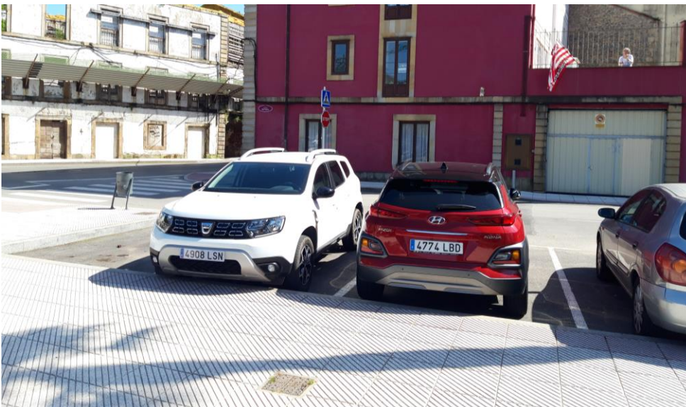
Figura 2: plaza de aparcamiento actuales en el callejón del Cantu.

2.2 Para quien viene en coche y empieza la ruta desde el aparcamiento de la N632, prever la predisposición de al menos dos plazas de aparcamiento con tarjeta azul de discapacidad en el callejón del Cantu (Figura 2).