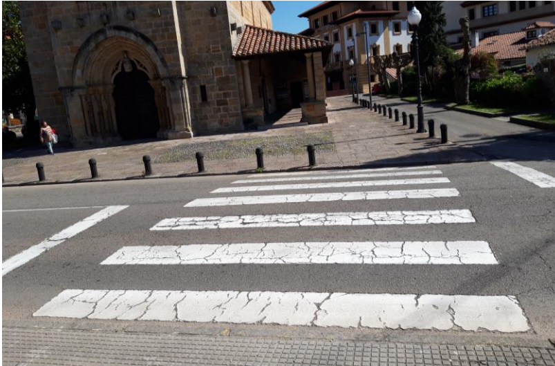
Figura 3: paso de peatones de C/Cabanilles, situada de frente a la iglesia de la Oliva.

2.4 Adaptar el paseo de peatones de la plaza José Cavada y Nava (Figura 4).